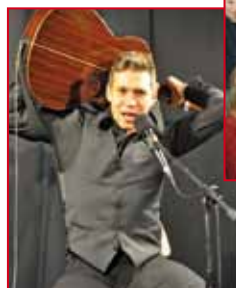
Anregende Begegnungen fördern die Entfaltung der Fantasie.