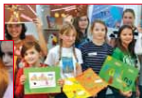
Theaterspiel und andere kreative Veranstaltungen entwickeln die Leselust.