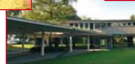
1957 wurde die Stadtbücherei im „Baumhaus“ am Gemeindedreieck eröffnet.