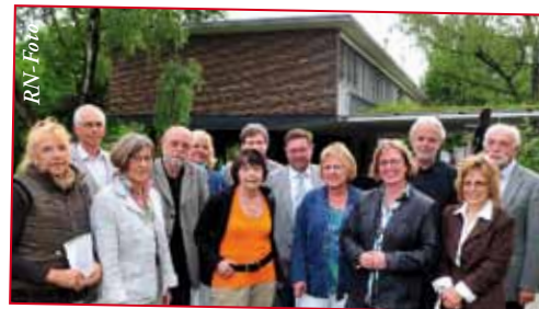
Die Gründungsmitglieder des Vereins am 1. Juni 2010 vor der alten Bücherei.

Diesem Ziel fühlt sich der Förderverein Cornelia Funke Baumhaus verpflichtet. In Kooperation mit der Dorstener Stadtbibliothek knüpfen Kinder und Eltern, Schüler und Lehrer, Vorlesepaten, Verlage und andere engagierte Leseförderer gemeinsam an einem starken Netzwerk zur Förderung der Lesekultur. Jeder ist herzlich willkommen, als Multiplikator mitzuwirken, auf dass sich bei den Menschen tausend Türen im Kopf und im Herzen öffnen mögen.